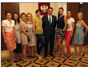
Lecture of Aleksandr A. Pankin, First deputy, Permanent Mission of the Russian Federation to the UN

Также для слушателей были организованы визиты в ООН, Федеральный Резервный Банк Нью-Йорка, Блумберг, Нью-Йоркскую Фондовую Биржу, Мэрию Нью-Йорка, Посольство РФ в Вашингтоне, Сенат США и Белый Дом.